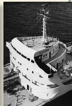
De navigatiebrug en verblijven