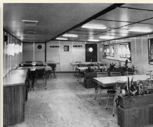
Bemannings mess room