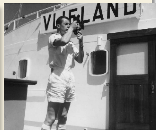
Stuurman 'schiet zonnetje' - 1963