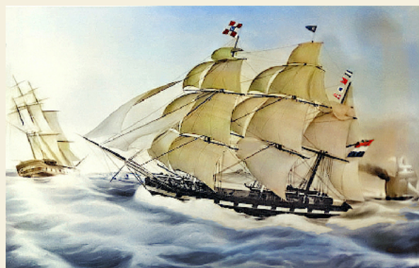
Aquarel Barkschip Doelwijk - Collectie stichting Kaap Hoornvaarders - 1851

Tweedeks barkschip met passagiersaccomodatie met drie masten. Tuigage: twee dwarsgetuigde masten en een schoenergetuigde mast. Lengte x Breedte x Diepgang = 37,7 x 6,8 x 5,7 m. Last: 383. Gewicht: 730 ton.