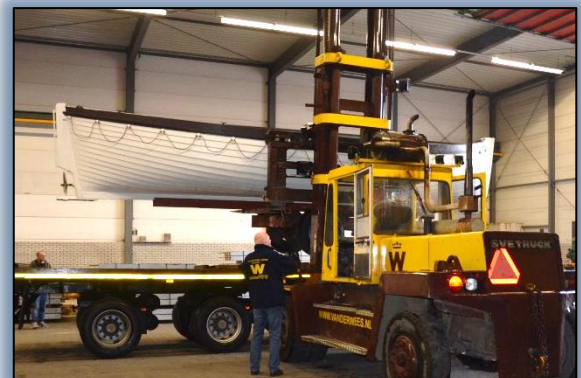
Arie ontvangt sloep bij KVDW