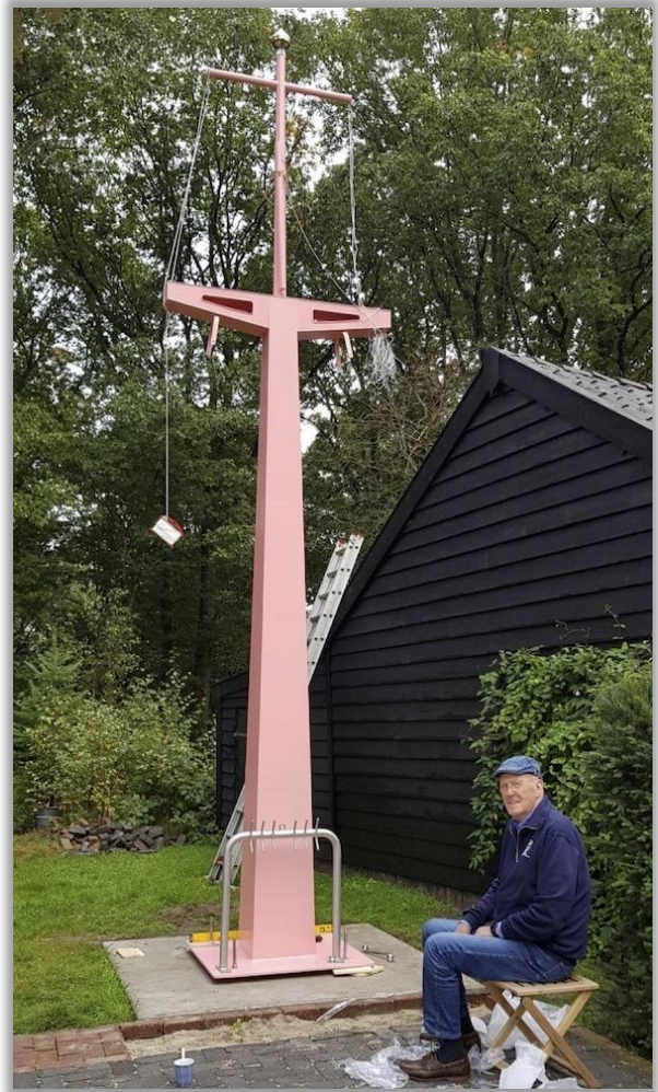
Moe maar voldaan