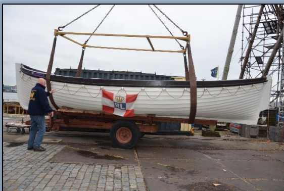
Laatste Inspectie bij "De Delft " door Arie