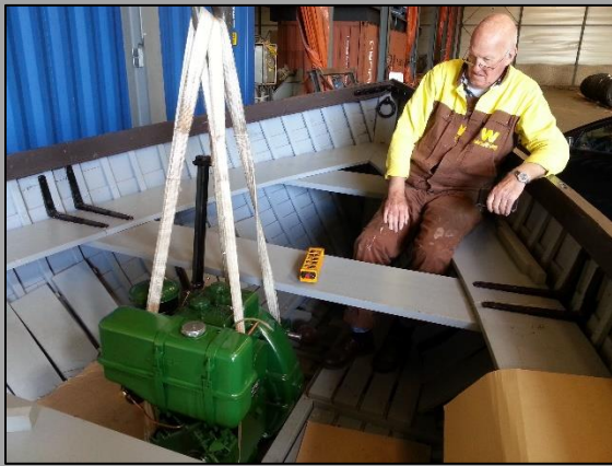
montage van de Lister