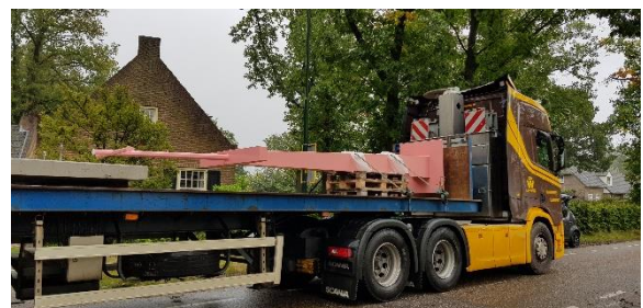
Koninklijke Van Der Wees verzorgde het transport