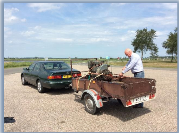
De 2 nd controleert of de diesel nog zeevast staat

De Lister wordt overhaald en een proefstart is succesvol. De Lister wordt nog opgespoten en vervolgens gereed gemaakt om in de sloep te worden ingebouwd. Deze is inmiddels ook bij Van Der Wees aangekomen en in een opslagloods geplaatst.