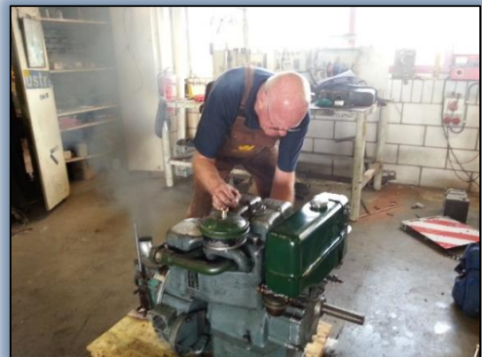
Proef start na overhaul