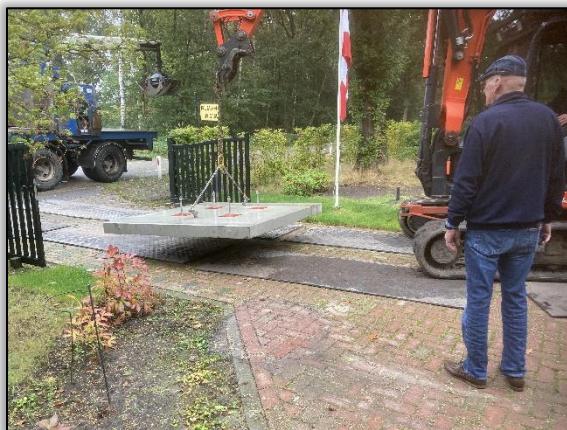
Arie geeft instructies

Arie's laatste werkzaamheden. De montage van de mast is middels onderstaande foto's in beeld gebracht.