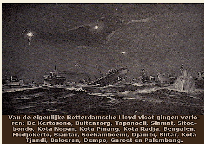
Van de eigenlijke Rotterdamsche Lloyd vloot gingen verloren: De Kertosono, Bultenzorg, Tapanoeli, Slammat, Sitoebondo, Kota Nopan, Kota Pinang, Kota Radja, Bengalen, Modjokerto, Siantar, Soekamboemi, Djambi, Blitar, Kota Tjandi, Baloeran, Dempo, Garoet en Palembang.