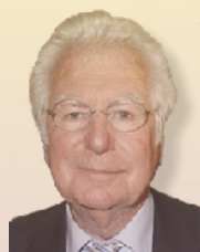
Gerard Cox Acteur, zanger, scenarioschrijver, cabaretier, columnist te Rotterdam.