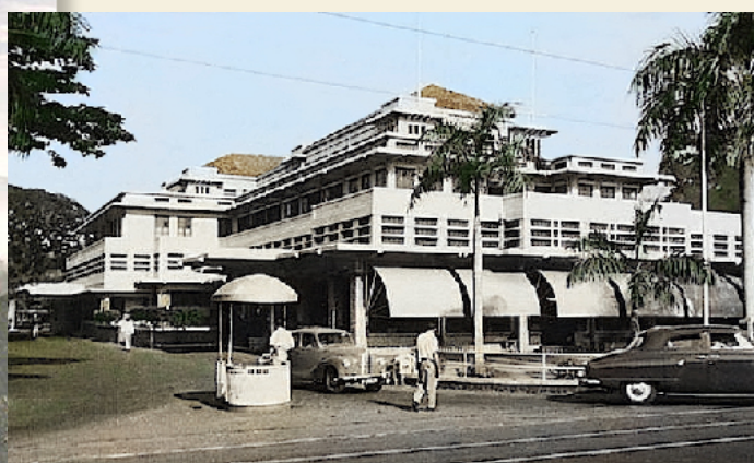
Hotel Batavia (Des Indes)