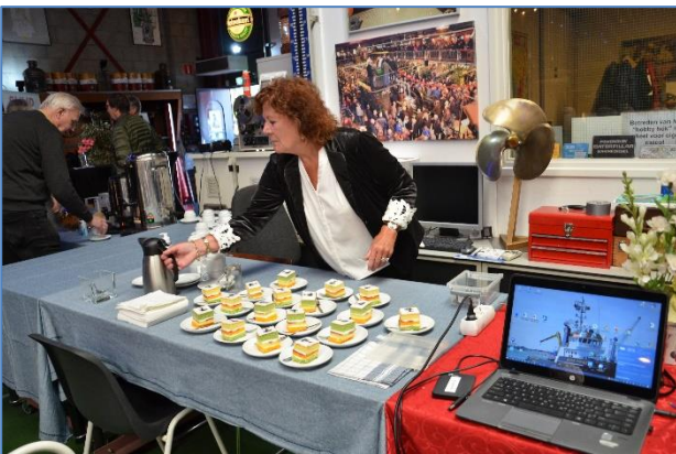
De koffie en petitfour wordt gereed gezet.