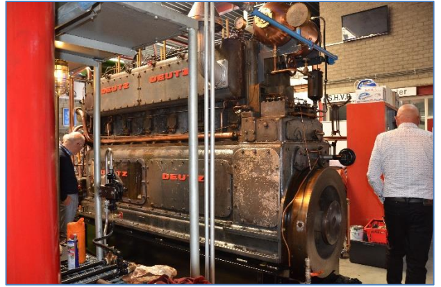
Deutz, de nieuwe aanwinst voor SHVP