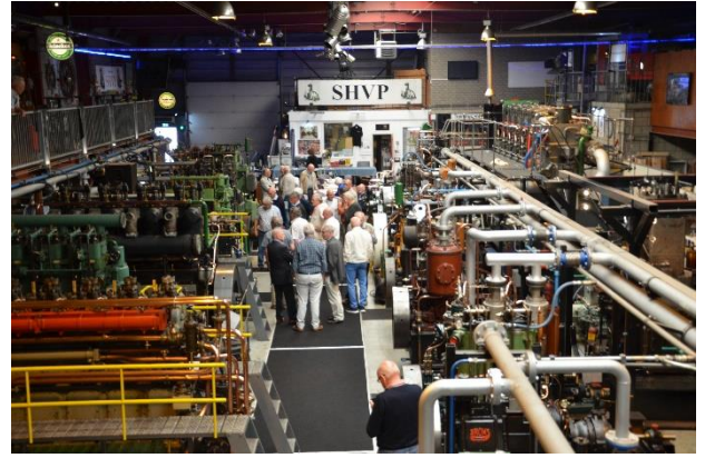
Er wordt aandachtig geluisterd