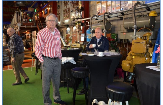
Het ontvangst comité.