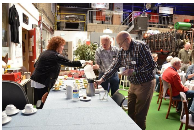
Een lekker kopje koffie