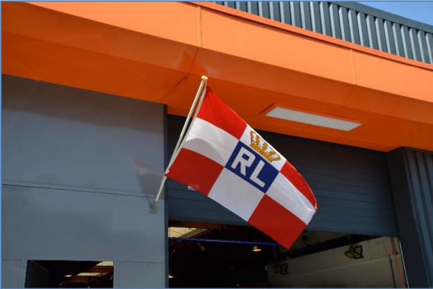
Trots wapperende KRL vlag