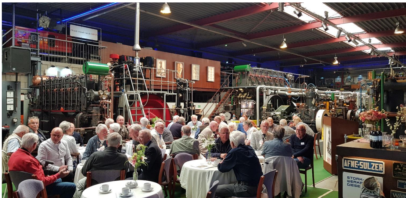
Gezellige drukte bij Stichting Historische Verbrandingsmotoren Papendrecht