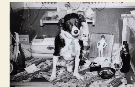
Boven: De geliefde scheepshond 'Schoffie' - 1961