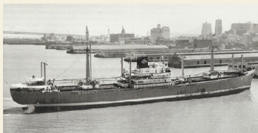
Het ms Wonogiri vaart San Francisco harbour binnen 1955