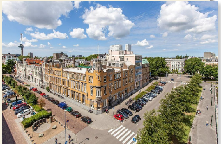
Birds' eye view van Veerhaven nummer 7