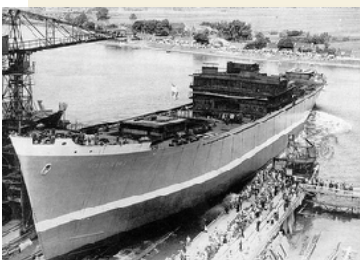
Tewaterlating - 1953

Vrachtschip met ongeveer 58 bemanningsleden en passagiersaccommodatie voor 12 reizigers. Open shelterdek met twee dekken. Roepletters: PIRO. Lengte over alles: 154,8 meter, breedte: 20,2 meter, holte: 12,2 meter, diepgang: 8,2 meter. Bruto tonnage: 7.596 reg. ton, netto tonnage: 4.206 reg. ton. Deadweight: 10.640 ton. Motor: MAN-dieselmotor - 8.250 rpk, tien cilinders die één schepsschroef aandreven, goed voor een dienstnelheid van 16 zeemijl/uur.