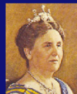
Het heeft Hare Majesteit Koningin Wilhelmina behaagd

Voorafgaand aan het in de vaart komen van de Willem Ruys, die op 8 december 1947 haar 'maiden trip' naar Nederlands Indië aanving, werd de N.V. Rotterdamsche Lloyd op 27 november 1947 door Koningin Wilhelmina het predikaat: ' Koninklijke ' verleend. Op 1 januari 1970 werd met de Stoomvaart Maatschappij Nederland (SMN), de KPM (deze was reeds gefuseerd met de KJCPL ) en de VNS de grote scheepvaartfusie aangegaan, waarvan de naam in 1977 is bepaald op: Koninklijke Nedlloyd Groep B.V. te Rotterdam .