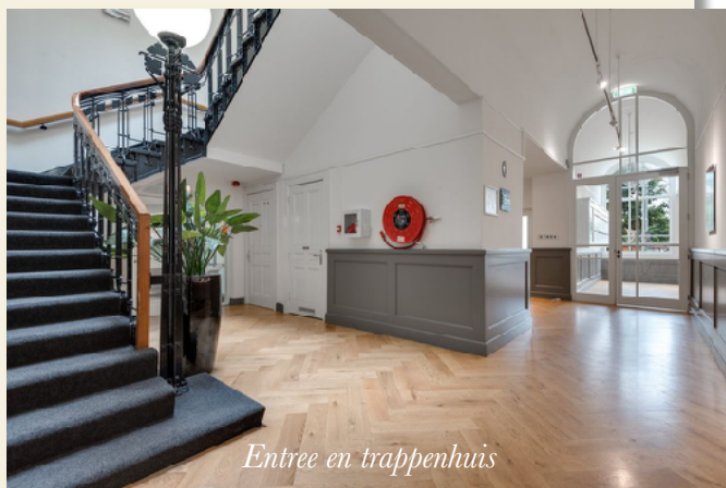
Entree en trappenhuis

Openen, distribueren en verzenden van de post. Reclame artikelen, drukwerken, registreren van de correspondentie.