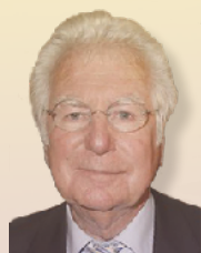
Gerard Cox Acteur, zanger, scenarioschrijver, cabaretier, columnist te Rotterdam.