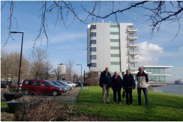
Organisatie oud WTK's bij Delta Hotel