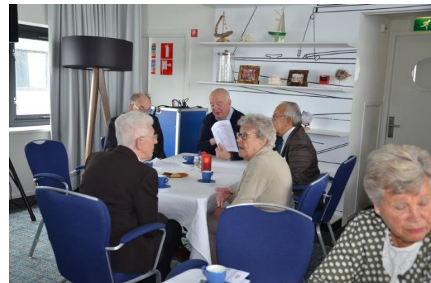
Even bij kletsen