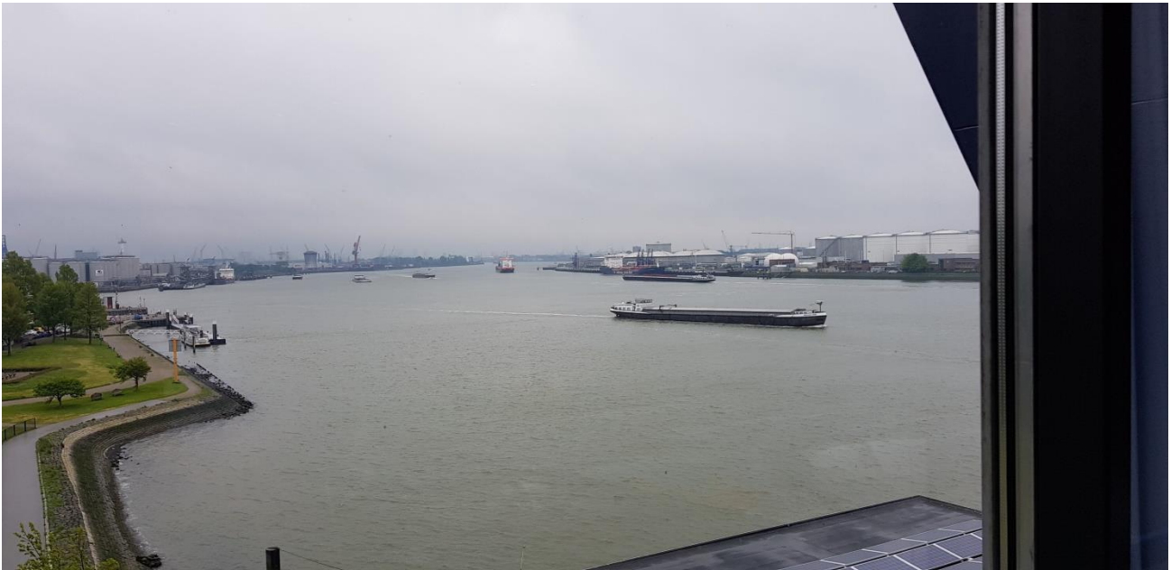
Een prachtig uitzicht over de Nieuwe waterweg