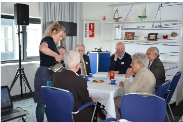
De koffie wordt geschonken