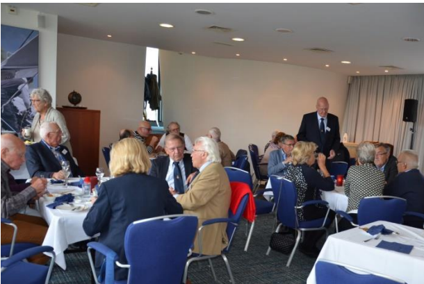
Nog even napraten